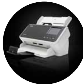
Alaris S2060w/S2080w Scanner