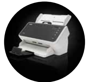
Alaris S2040/S2050/S2070 Scanner